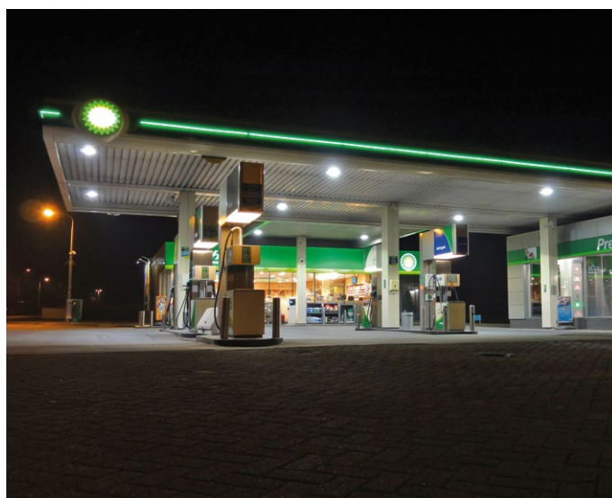
Luifelverlichting in combinatie met onze decoratieve LED-verlichting geeft een tankstation meer uitstraling.

Het LED-luifelarmatuur wordt vaak éénmalig ingesteld en zijn o.a. de volgende instellingen mogelijk: